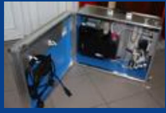
HORIBA PG 250