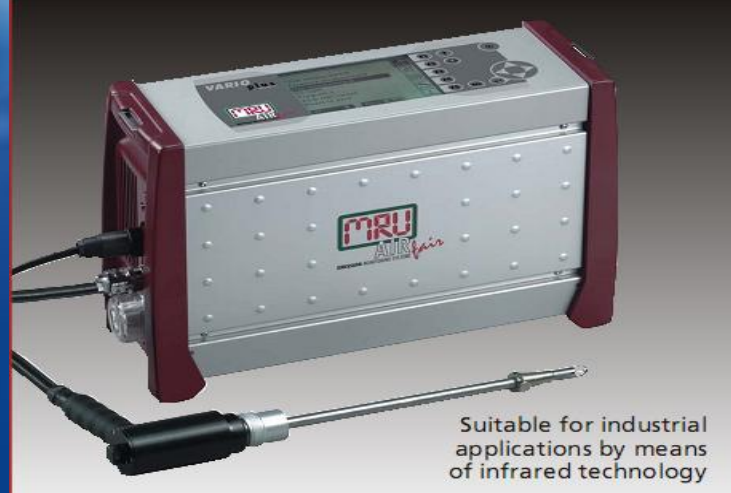
Analizor portabil automat Vario Plus - MRU

Laboratorul are experiență și oferă următoarele tipuri de servicii: