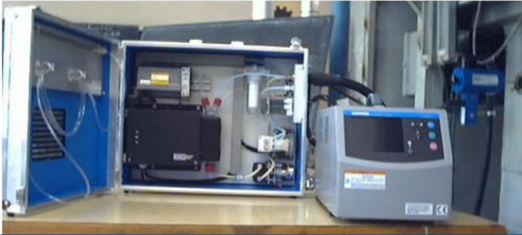
Analizor portabil automat PG 250 - Horiba

Laboratorul de Încercări Fizico-Chimice din cadrul INCDTurbomotoare-COMOTI are în dotare echipamente de ultimă generație pentru monitorizarea emisiilor, a temperaturii și vitezei de evacuare a gazelor la sursă: