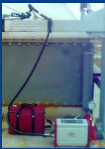
MRU - Vario Plus