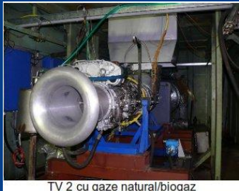
TV 2 cu gaze natural/biogaz

Determinarea concentrațiilor de gaze de ardere (CO, CO 2 , NO x , SO 2 , O 2 ) din efluenții gazoși reziduali (emisii) (Metodă Acreditată RENAR)