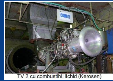
TV 2 cu combustibil lichid (Kerosen)